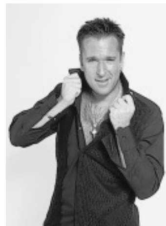
Schwarm der Frauen: Michael Wendler erlebt einen Höhenflug.